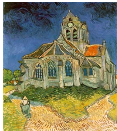
Van Gogh - L'église d'Auvers